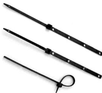
写真2 アースバンド

*一般的に、感電防止のための電気器具漏洩抵抗は 10^5 \Omega 以下、静電気がほとんど起きないのは、 10^9 \Omega 以下と言われている。