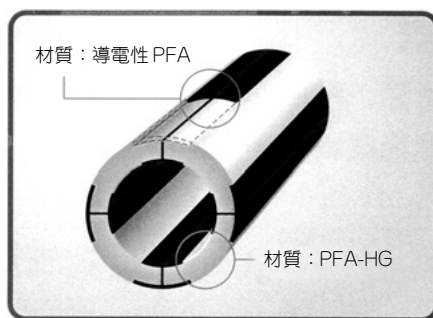
図1 チューブ断面図

ナフロン®PFA-ASチューブは図1に示すように、ナフロン®PFA-HGチューブの内・外層部にサイズ毎に一定幅及び厚みのストライプ状導電性PFA部を備えたチューブです。PFA-HGと導電性PFA部は熔融状態で一体成形されているため剥がれるなどの心配がありません。