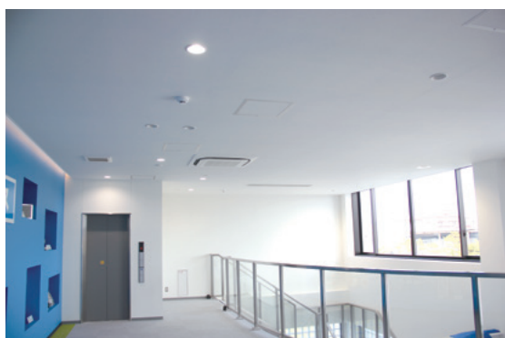
図3 エコラックス® 施工例 (天井, 側壁)

【問い合わせ先】 ニチアス(株) 建材事業本部 TEL : (03) 4413-1161