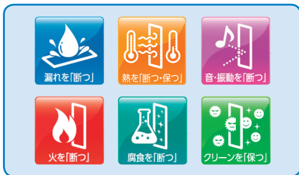
「断つ・保つ」の6つの技術をアイコンでわかりやすく分類した展示