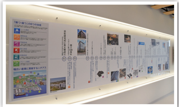
「断つ・保つ」の技術の歴史