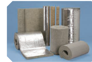
ロックウール製品

2004年 オゾン層保護・地球温暖化防止大賞優秀賞受賞 フロン製の発泡剤を含まない点が評価されました