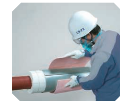
保温メンテナンス工事「増し保温® 工法」

2015年 省エネ大賞受賞 幅広い工業炉の省エネ化を推進できる点、燃料電池用などの用途でも拡大が期待できる点が評価されました